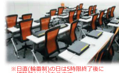
※日直(検査制)の日は時間終了後に掃除機かけがあります。

AdobeCCイラストレーター、フォトショップ、XD、AfterEffectsをはじめとしたクリエイティブ重視のカリキュラムがメイン。 PCサイトやスマホサイトはもちろん、名刺やロゴなどのグラフィックデザイン、Webマーケティングの時間も充実。ネットショップ業界必須のワードプレスも学ぶほか、応募先企業の目に留まるポートフォリオの作成も実施します。受講者全員にサーバを無料貸与し、全員のサイトを公開するので、就活先に制作実績としてアピールすることができます。就職支援では、IT企業ならではの業界内人脈を生かし、現場が求める求人情報、求人情報を提供します。充実した設備と実践に即したカリキュラムは、多くの修了者から非常に高い評価をいただいております！