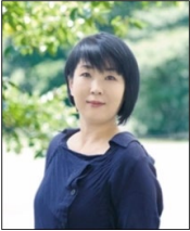
↑現役Webクリエイター

講師陣は、Webデザイナー、映像ディレクター、Webコンサルタントなど、第一線で活躍するプロフェッショナルぞろい。