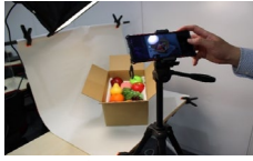
↑スチール撮影実習