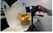
↑スチール撮影実習