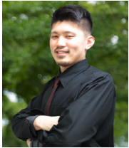
↑デザイナー カナザワ先生

講師陣は、Webデザイナー、プロカメラマン、映像ディレクター、Webコンサルタントなど、第一線で活躍するプロフェッショナルぞろい。