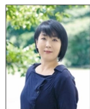
↑現役Webクリエイター

講師陣は、Webデザイナー、プロカメラマン、映像ディレクター、Webコンサルタントなど、第一線で活躍するプロフェッショナルぞろい。