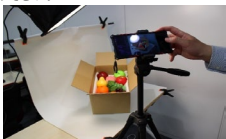
↑スチール撮影実習