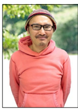
↑グラフィックデザイナーのPhotoshop、Illustrator講義担当

講師陣は、Webデザイナー、プロカメラマン、映像ディレクター、Webコンサルタントなど、第一線で活躍するプロフェッショナルです。