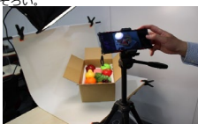
↑スチール撮影実習