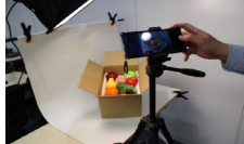
↑ スチール撮影実習