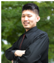
↑ Webデザイン講師担当

講師陣は、Webデザイナー、映像ディレクター、Webコンサルタントなど、第一線で活躍するプロフェッショナルぞろい。