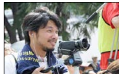
↑動画撮影指導は、現役映像ディレクターの弓田先生