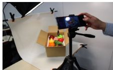
↑ スチール撮影実習