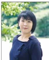
↑ 現場Webクリエイター

講師陣は、Webデザイナー、映像ディレクター、Webコンサルタントなど、第一線で活躍するプロフェッショナルぞろい。